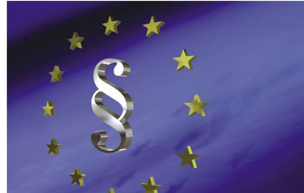
Mehr Rechtssicherheit in Europa: Der Europäische Vollstreckungstitel vereinfacht es, Forderungen gegen Schuldner aus anderen Mitgliedsstaaten der EU einzutreiben.

Für die Vollstreckung im ausländischen EU-Staat gilt das Recht des Vollstreckungsstaates. Darüber hinaus müssen Antragsteller dort die zu vollstreckende Entscheidung, die selbst nicht mit einer Vollstreckungsklausel versehen sein muss, und die Bestätigung als Europäischer Vollstreckungstitel vorlegen.